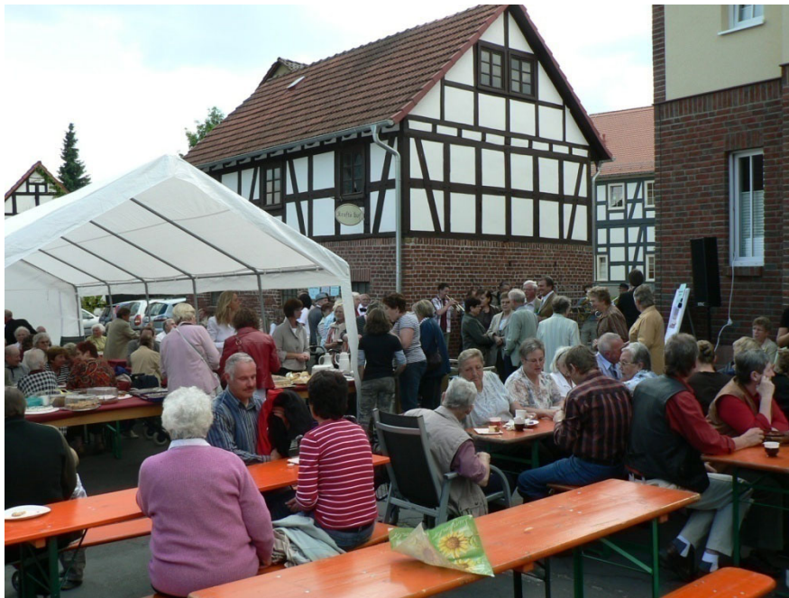
Hoffest am 15.06.2008