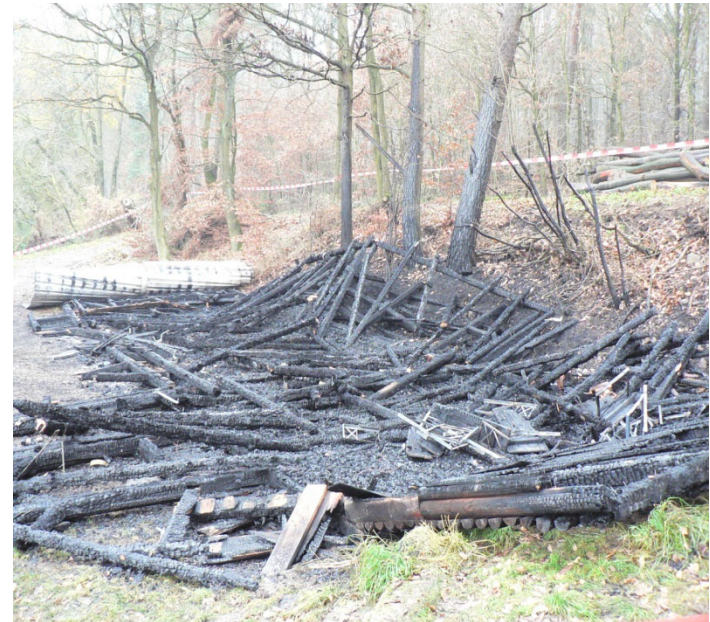
Nur noch verkohlte Balken